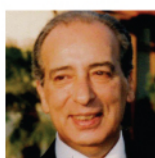
Ιωάννης Μώρος - Καθηγητής Αγγειοχειρουργός

Αποφοίτησε από την Ιατρική Σχολή Α.Π.Θ. Για 7 χρόνια υπηρέτησε ως Διευθύντρια Αναισθησιολογίας στο Π.Γ.Ν.Θ. ΑΧΕΠΑ. Έως το 1999 διετέλεσε Διευθύντρια Αναισθησιολογικού τμήματος στο Κεντρικό Νοσοκομείο, καθώς και Διευθύντρια ΕΣΥ στο ίδιο Νοσοκομείο.