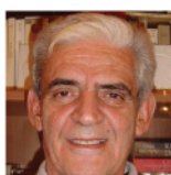
Αθανάσιος Κουλούλας - Καθηγητής Διευθυντής Α΄ Ωτορινολαρυγγολογικής Κλινικής

Ο καθηγητής Αθανάσιος Κουλούλας είναι απόφοιτος της Ιατρικής Σχολής Α.Π.Θ. Μετεκπαιδεύτηκε στην Ωτορινολαρυγγολογική Κλινική του Πανεπιστημίου του Liverpool. Το 1976 έγινε Πανεπιστημιακός Επιμελητής της Κλινικής του Αριστοτελείου Πανεπιστημίου Θεσσαλονίκης. Τον Ιούνιο του 2005 εκλέχθηκε Διευθυντής της Α΄ Ωτορινολαρυγγολογικής Κλινικής του Α.Π.Θ.